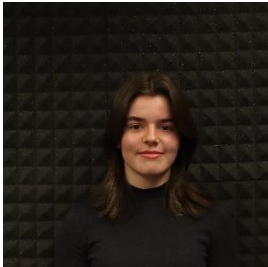
Hofer Greta Net la a macchina, sondon frisch a grattl.