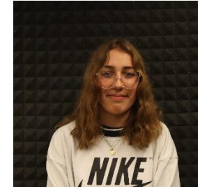
Hanni Alexandra Overthinking but can't think during exam