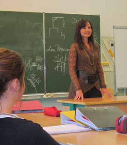
KUSINE AUS AMERIKA // Foto: INGRID PATZLEINER